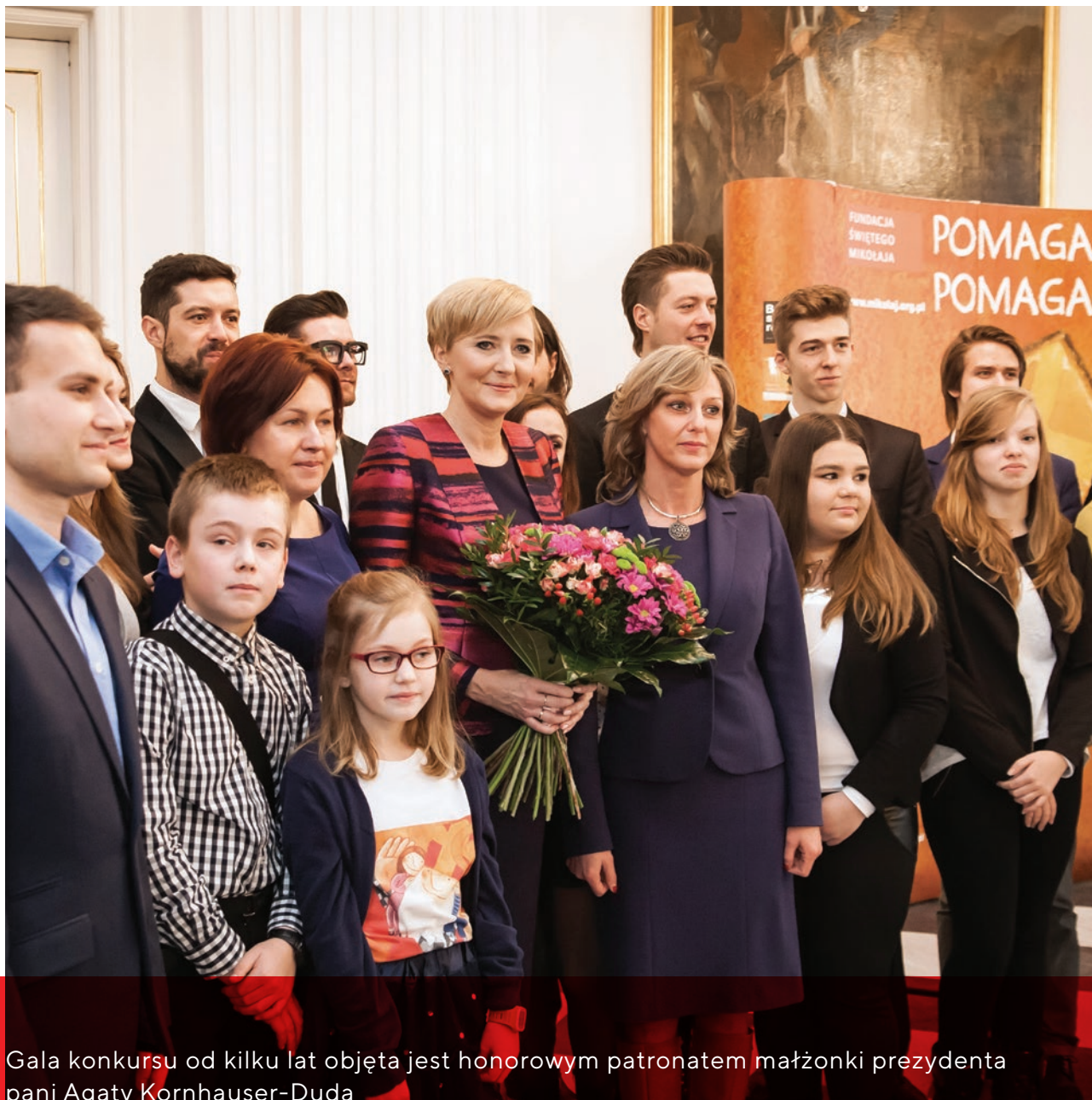
Gala konkursu od kilku lat objęta jest honorowym patronatem małżonki prezydenta pani Agaty Kornhauser-Duda