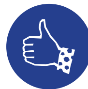
Zaangażowanie w życie szkoły i/ lub społeczności lokalnej

„Od czterech lat uczęszczam na zajęcia plastyczne, na których uczę się rysunku i malowania obrazów techniką olejową. Pieniądze otrzymane ze stypendium przeznaczyłam na zakup potrzebnych do tego materiałów .